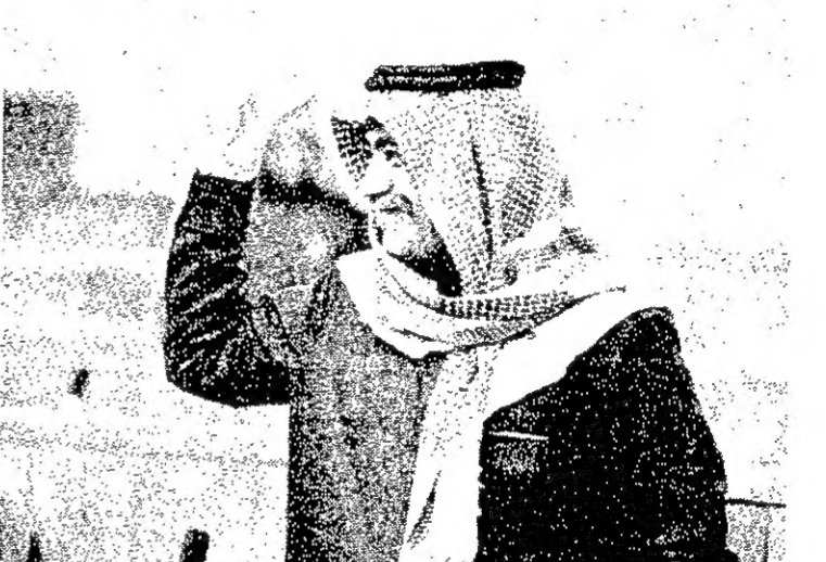
دحياتي الى اللقاء في الجلسة المقبلة